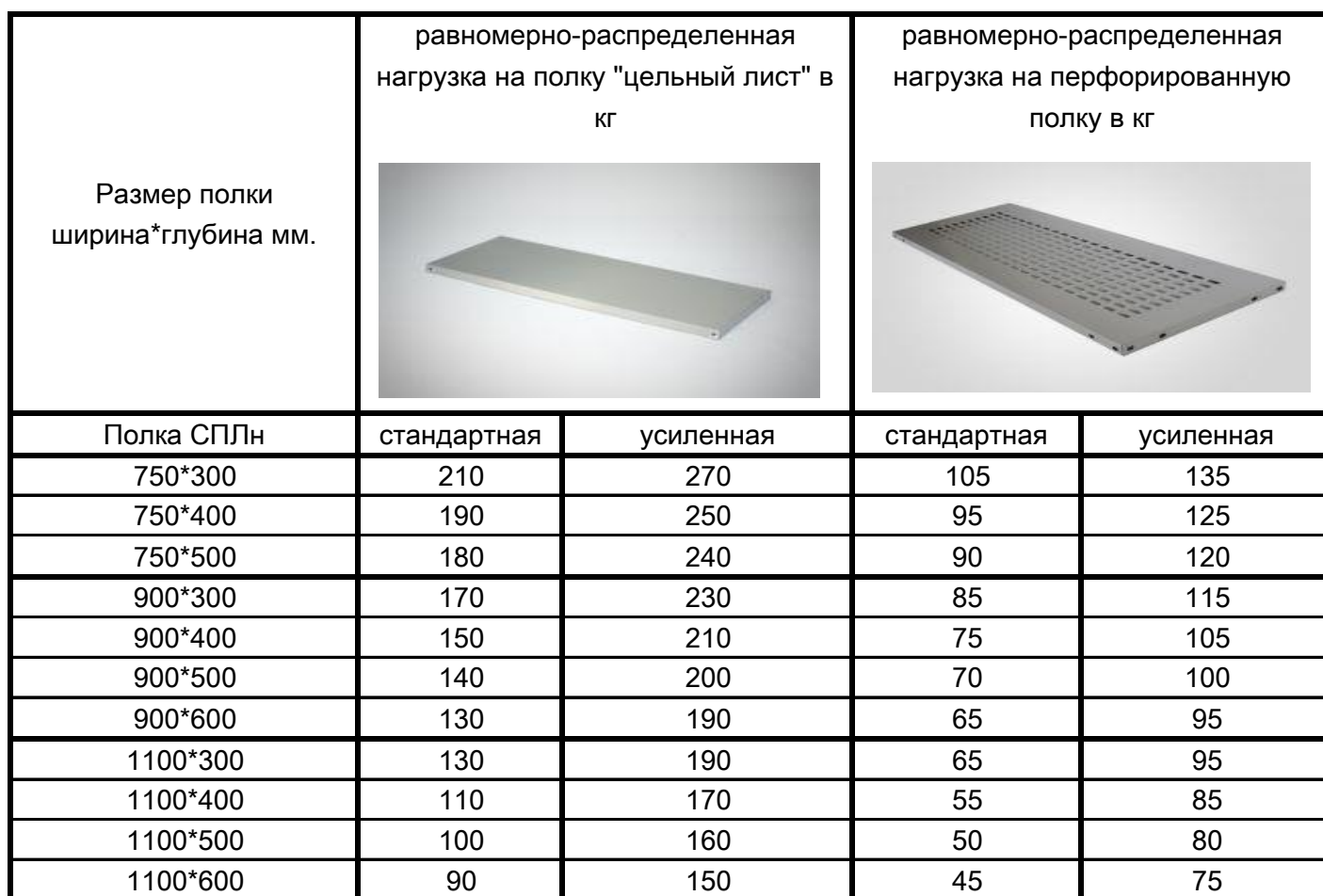
ТАБЛИЦА нагрузок на полки из нержавеющей стали